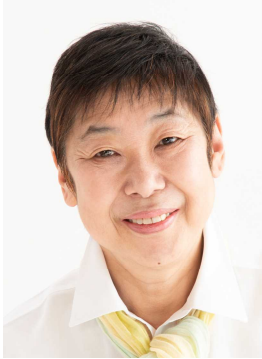
三鷹市議会議員 無所属