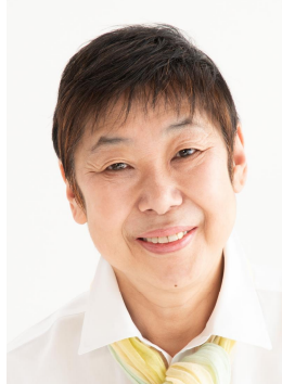
三鷹市議会議員 無所属